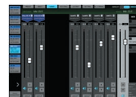
TASCAM DCP CONNECT